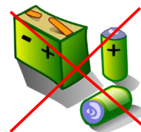
Farligt avfall som batterier och elektronik