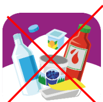
Metall, glas och plastförpackningar