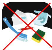
Papper och sanitetsartiklar