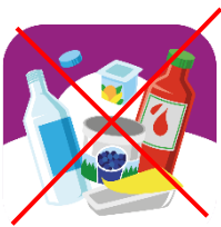
Metall, glas och plastförpackningar