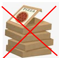
Lådor och papperförpackningar