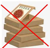
Lådor och papperförpackningar